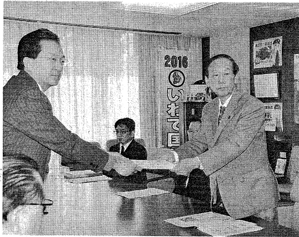
達増知事から要望書を受け取る山口俊一財務副大臣(右)

添つて復興を進めていく必要がある。国家的事業としての復興をお願いしたい」と述べた。 要望書では、地方が使いやすい財源の確保や復興事業の予算執行の柔軟化、専門知識を持つマンパワーの支援などを要請。消費税に